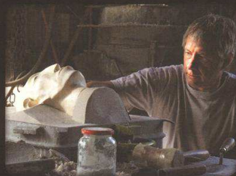
Fabrication du moule. Ici, les parties médianes et avant