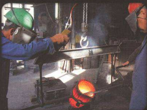
Le coulage du bronze nécessite une bonne coordination, car cette opération doit être rapide