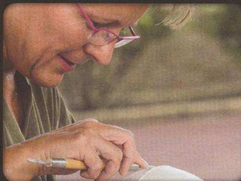
Le travail de finition : ponçage et raclage minutieux